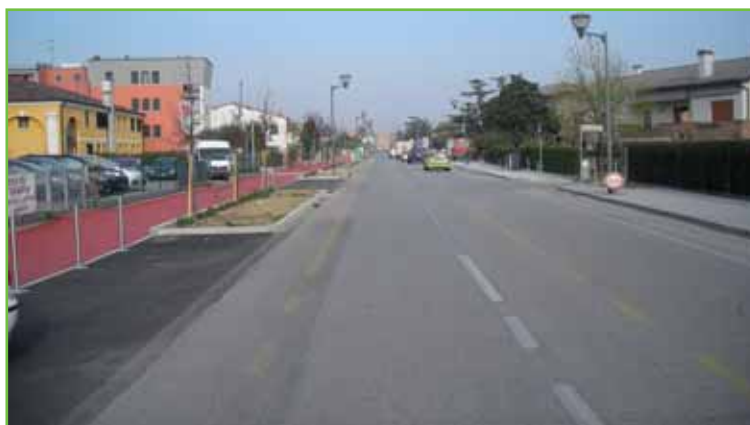
Via Polanzani "dopo"