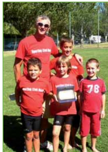
Triathlon - piccoli atleti crescono

Tutti coloro che fossero intenzionati a iniziare la pratica del Triathlon o volessero avere notizie al riguardo possono contattare la sede della Polisportiva, via De Pol 5, telefonando allo 041 442820 o direttamente il responsabile del settore al 335 8121349, visitare il sito www.sportingnoale.it o inviare una mail a vladi@vardiero.net