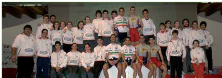
Squadra "agonisti" al gran completo