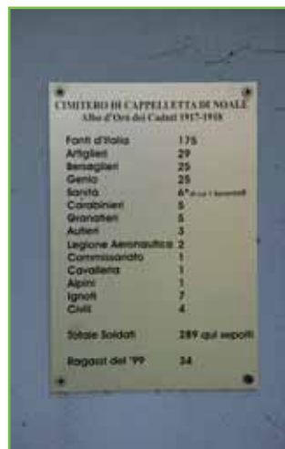
Albero d'Oro dei Caduti