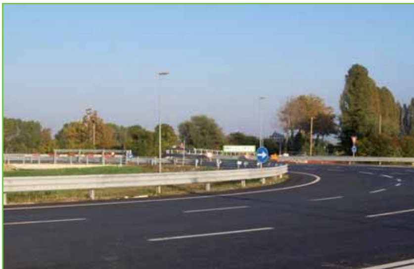
variante SR 515 in località “Pioppeto”