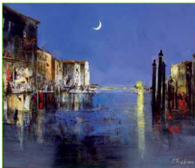
Trabucco - Notturmo in Canal Grande