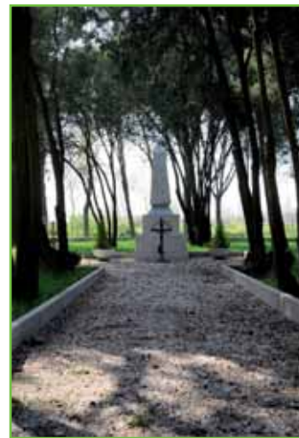
Cippo sepolcrale - Cappelletta