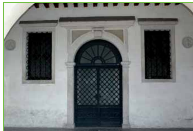
Ex Confraternita dei Battuti - ingresso