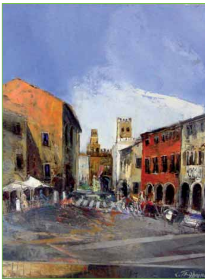
Trabucco - Piazza XX Settembre - Noale